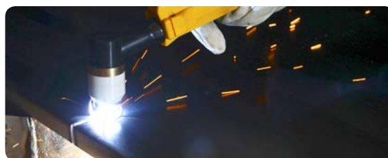
Ručné rezanie s PB-S45 WH