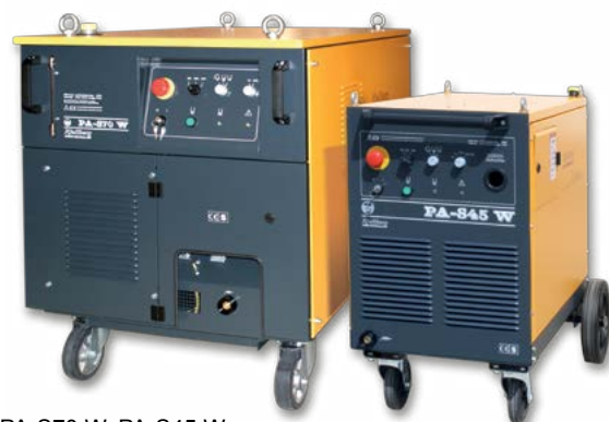
PA-S70 W, PA-S45 W

So zariadeniami rady PA-S možno vykonať tvarové rezy, priame rezy a ukosovanie do 60°.